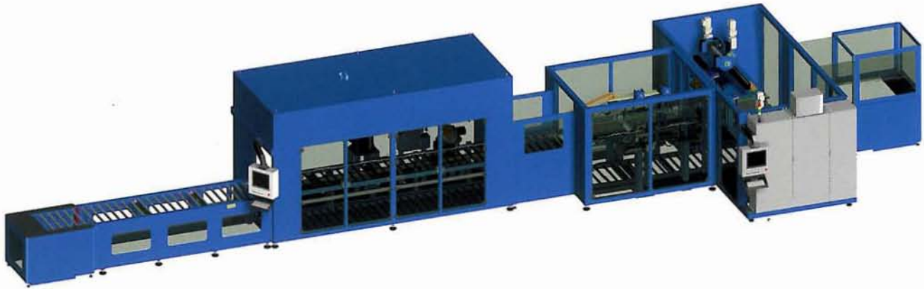
MFL 22940 Fading-Line: Fertigungsanlage um Teile einer Reihe von Prozessen zum Oberflächen-Finish zu unterziehen.