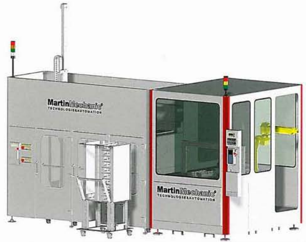
MRC 241110 RoboCube mit Palettenprofil

tieren verschiedene Ansätze und prüfen, welche Lösung optimal ist. Danach fixieren wir diese in einem detaillierten Angebot.