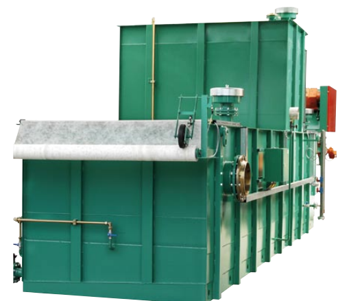
Unterdruck Bandfilter BUF