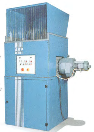
z. B. Modell CS 5000

Einfachste Bedienung. In verschiedenen Größen für fast jedes Müllvolumen lieferbar. Individuelle Abtransportmöglichkeiten.