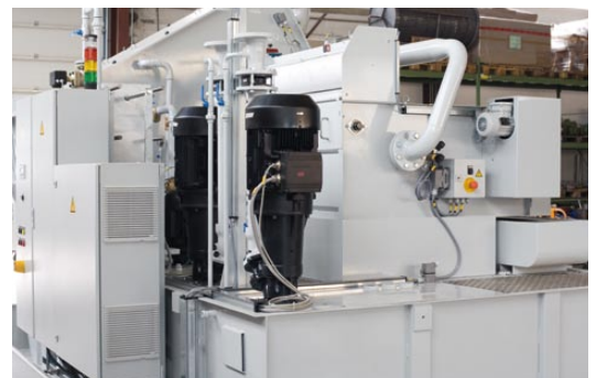
Tiefbettfilter mit Vlies auf kombinierter Anlage